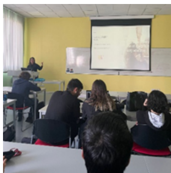
ID: Foto del evento multiplicador en Chipre