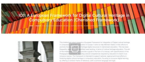
ID: Captura de pantalla de la página web del proyecto para el producto intelectual 1

PROMOVER la concienciación sobre la importancia de la preparación del patrimonio cultural readiness para la educación digital inclusiva en Europa.