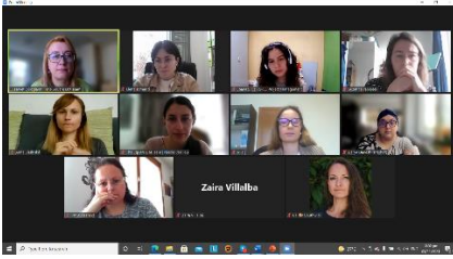
ID: Picture from the 2 nd Transnational Partner Meeting